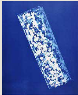
堂東由佳《poj#1》 サイアナタイプ・紙 2022年 GALLERY IND. 蔵