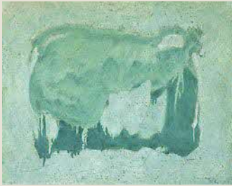
奥田善巳《像》 油彩・カンヴァス 1961年 西宮市大谷記念美術館蔵