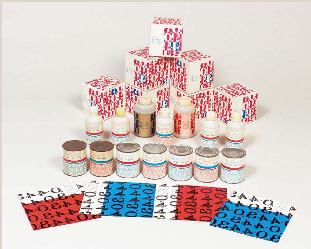
上：奥田善巳《エヴァのバーゲンセール（2点組）》1966年 紙（ポスター） 西宮市大谷記念美術館蔵