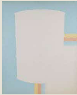
奥田善巳《ネガへの挑発》 油彩・カンヴァス 1967年 トアロード画廊蔵