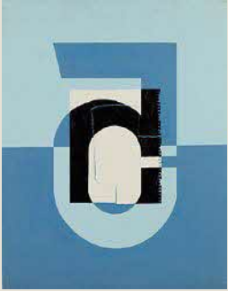
奥田善巳《数字5》 油彩・カンヴァス 1969年頃 当館蔵(令和8年度新規収蔵作品)