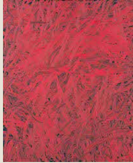
奥田善巳《CO-95》 油彩・カンヴァス 1983年 西宮市大谷記念美術館蔵

また奥田善巳の回顧展を開催するにあたり、併催展として奥田の母校である柏原高校において直近に美術の指導を行った美術作家・荒木孝典と版画家・堂東由佳を紹介します。