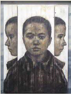
荒木孝典《R像(12月23日)》 膠彩、胡粉地・杉板 2018年 作家蔵

また奥田善巳の回顧展を開催するにあたり、併催展として奥田の母校である柏原高校において直近に美術の指導を行った美術作家・荒木孝典と版画家・堂東由佳を紹介します。